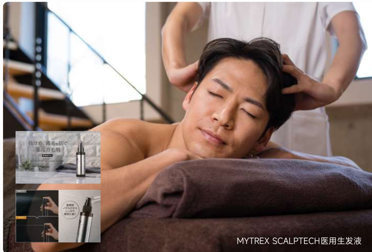
MYTREX SCALPTECH 医用生发液

Уникальная формула жидкости для роста волос не только эффективна, но и производится в соответствии с высокими стандартами GMP для обеспечения качества. Это действительно позволяет клиентам быть уверенными в том, что они смогут использовать его каждый день.